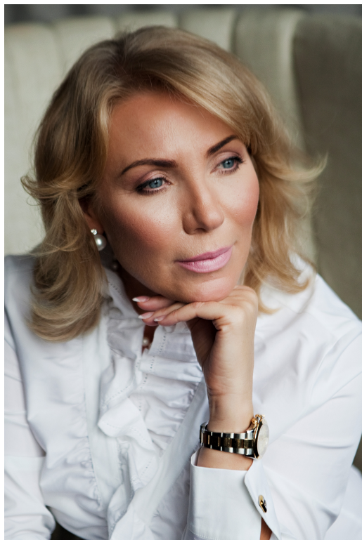
Председатель Координационного совета - д.т.н., профессор